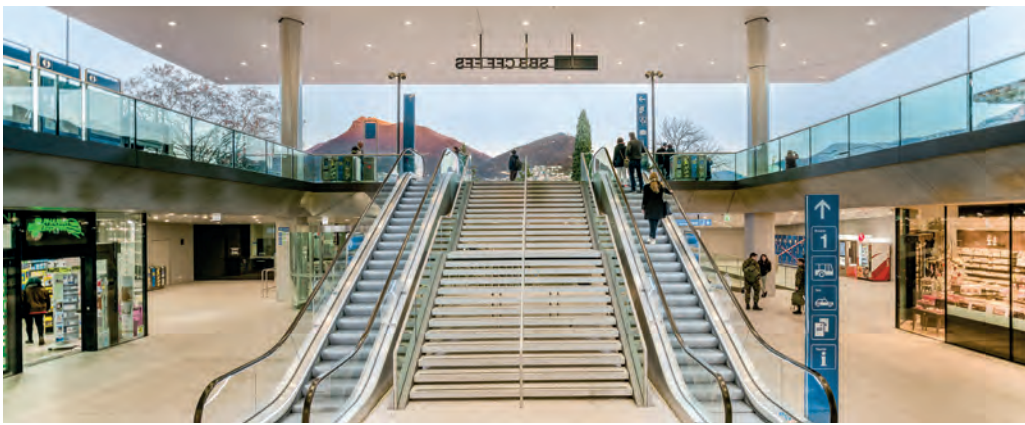
Der Blick geht hinaus, die Sonne hinein: das Atrium von «Lugano Centrale».