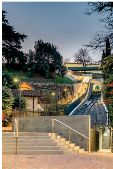
Vom Bahnhof geht es hinunter in die Altstadt – zu Fuss oder per Standseilbahn.